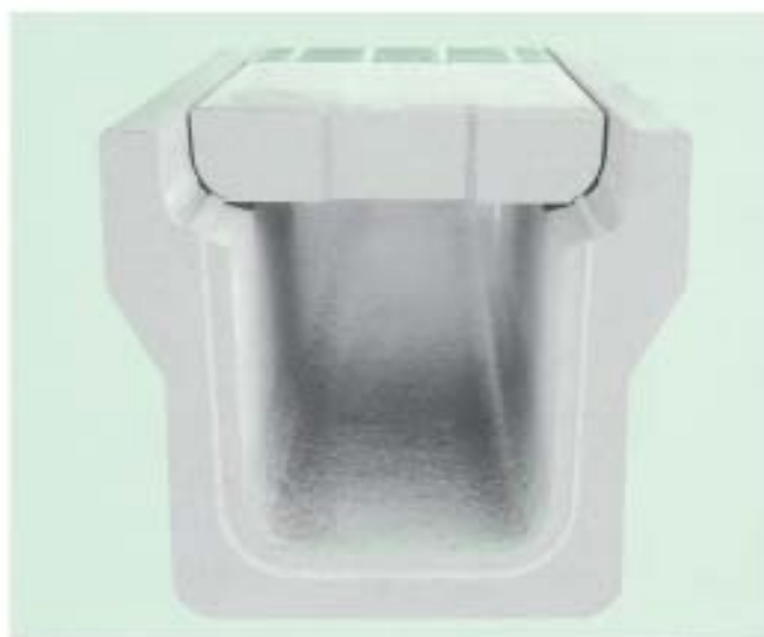
▲道路用鉄筋コンクリート側溝型 (GU-S) 車道用