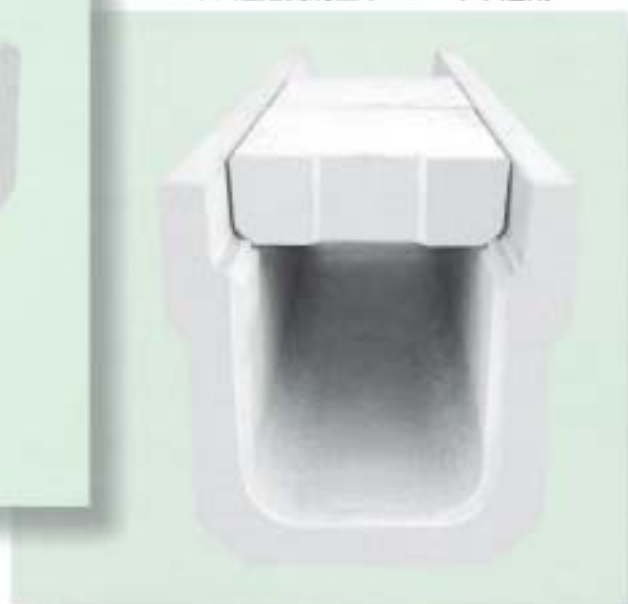
▼ニイツ道路側溝型 (NLD-S) 車道用